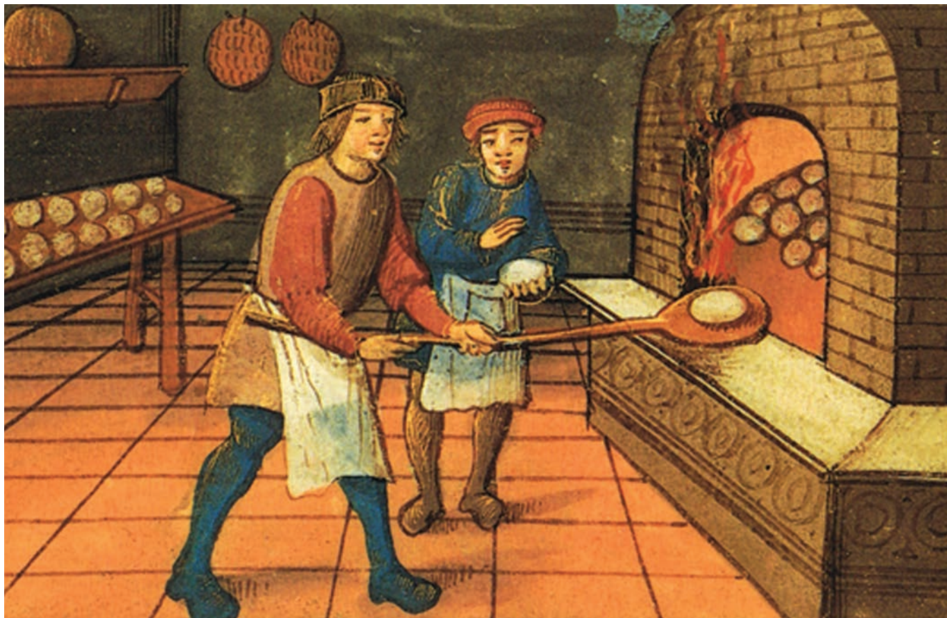
Figura 1. Um padeiro com seu assistente na Idade Média.