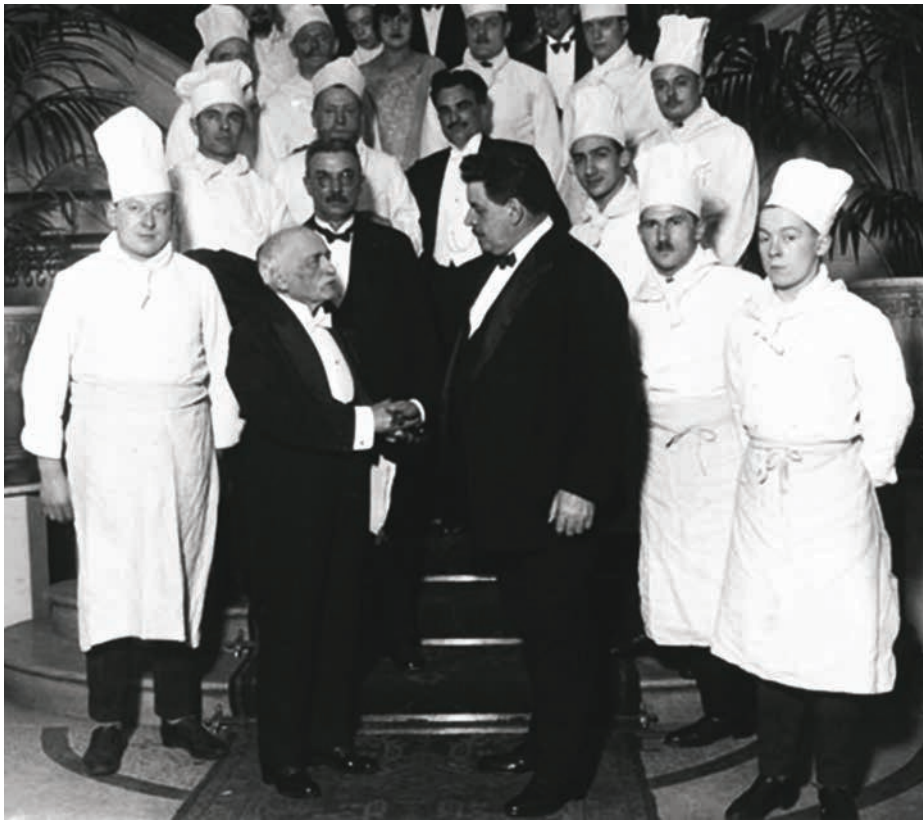
Figura 5. Auguste Escoffier (à frente e à esquerda) em meio à sua brigada de cozinha uniformizada, aperta a mão do Primeiro Ministro Édouard Herriot (a direita), 1928.

O chef também alterou as formas de preparações – inclusive dos molhos mãe que Carême havia instituído –, mantendo duas formas de executar uma receita, uma com horas de fogo, outra com 15 minutos; ele também acrescentou o molho de tomate como molho mãe e modificou o serviço, diminuindo o menu (não apenas quanto à complicação, mas considerando uma preocupação maior com a leveza dos preparos), até criar o menu à la carte, permitindo que o próprio cliente elaborasse a ordem de serviço que mais o agrada (JAMES, 2008).