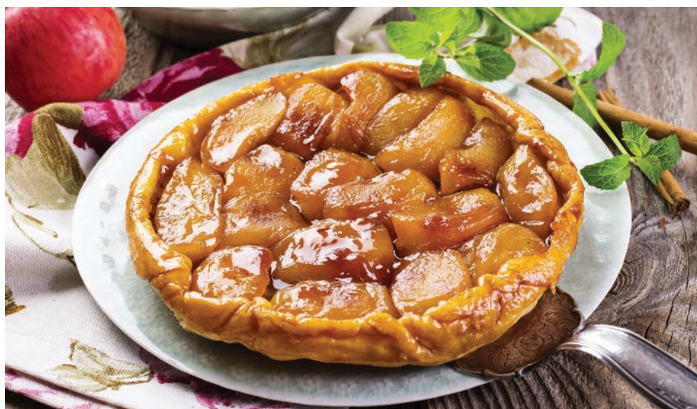
Figura 7. Tarte tatin

Conta a história que a célebre Tarte Tatin foi criação da desajeitada irmã Tatin, que derrubou a torta caramelizada de maçãs e terminou de cozinhá-la de ponta cabeça. Essas irmãs cuidavam de um hotel ao sul de Paris e, aparentemente, a receita da torta já era antiga, mas elas ficaram célebres por conta dessa história.