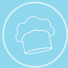
dica do chef